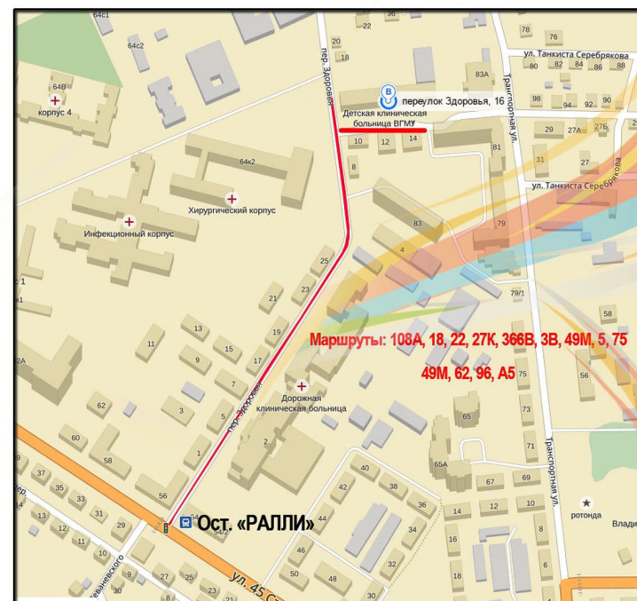
График работы с 8:00 до 16:00